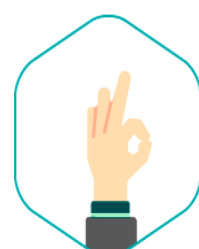
Un soutien technique

EPM intervient de manière transverse pour accompagner l'ensemble de vos projets sur le territoire international.