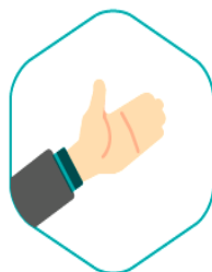
Une relation de partenariat